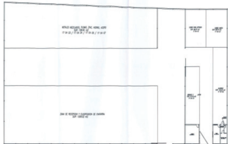
Fig 1: Plano planta